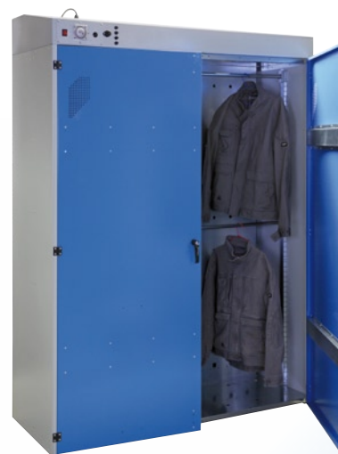
Séchoir Multi 1600 Vêtements sur 2 niveaux