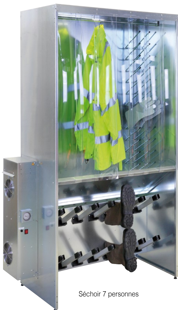
Séchoir 7 personnes