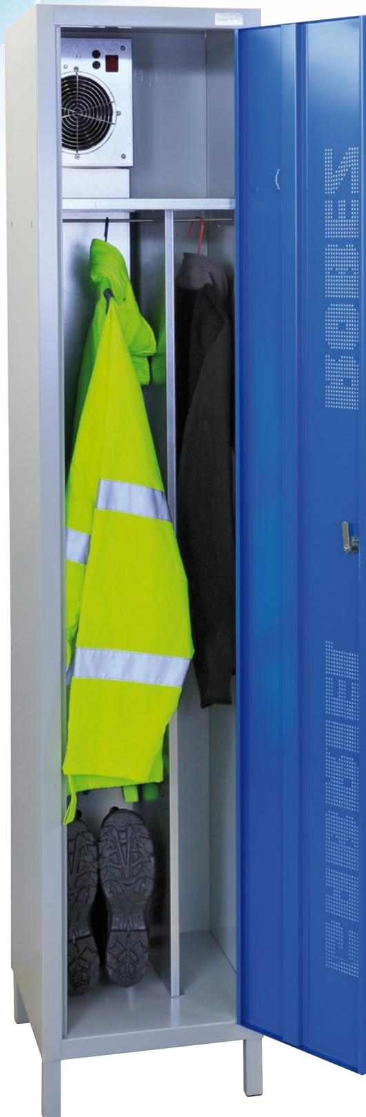
Vestiaire 400 Séparateur vertical