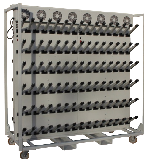
Fabrication Spéciale Sèche-chaussures à tiges