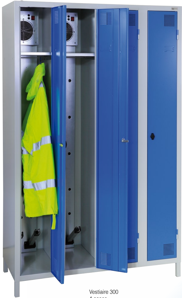
Vestiaire 300 4 cases