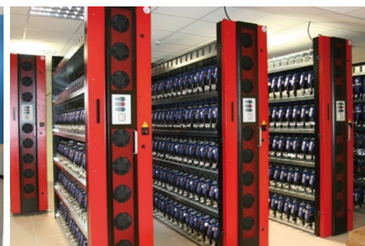
Installation de sèche-patins