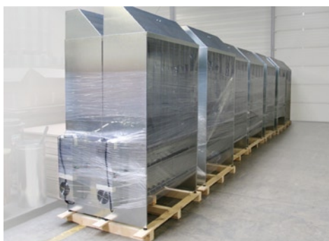
Sèche-vêtements avant expédition

Faites confiance à l'efficacité de nos produits alliant séchage et désodorisation.