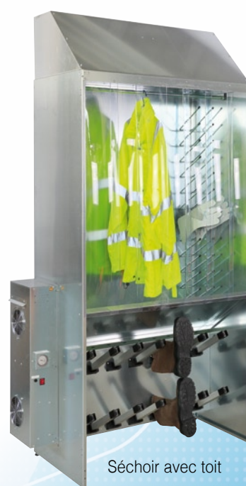
Séchoir avec toit