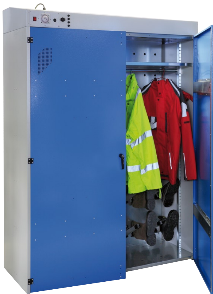
Séchoir Multi 1600

Ventilation par le fond perforé de l'armoire