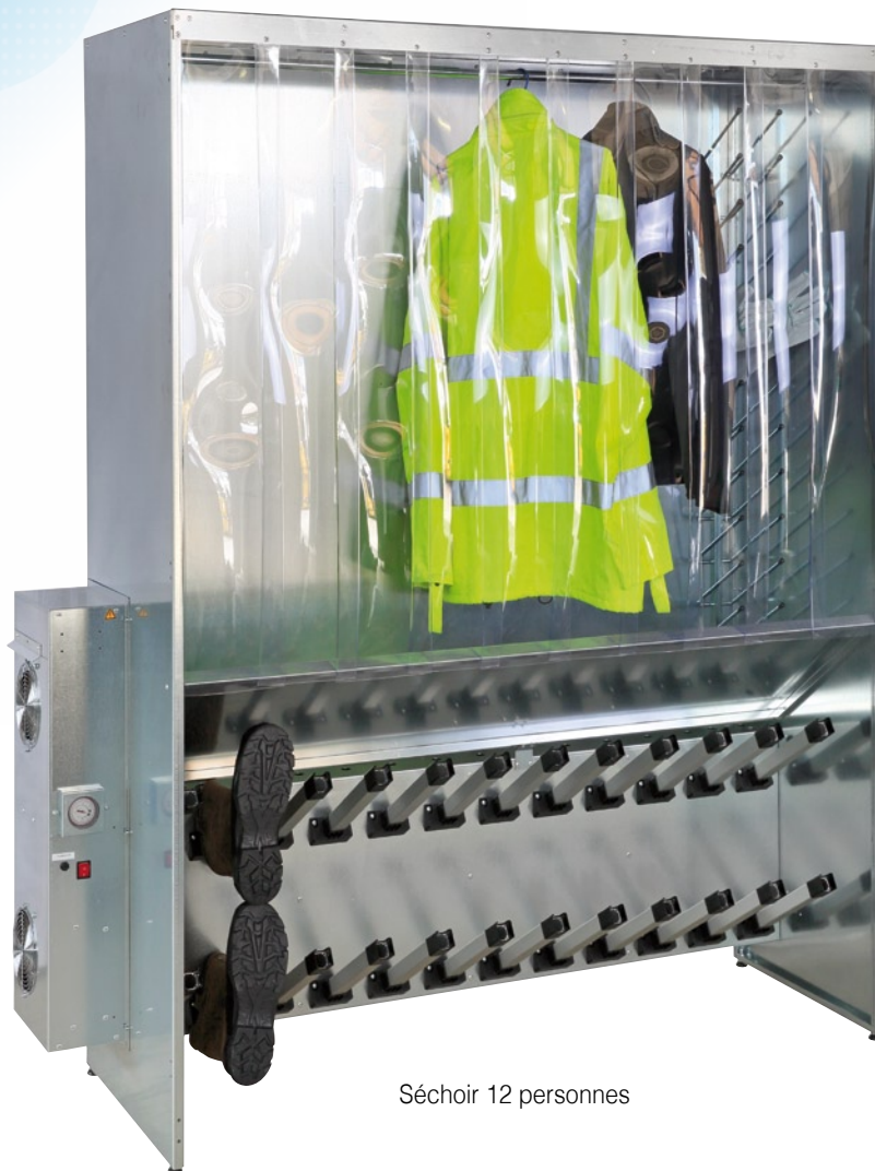
Séchoir 12 personnes