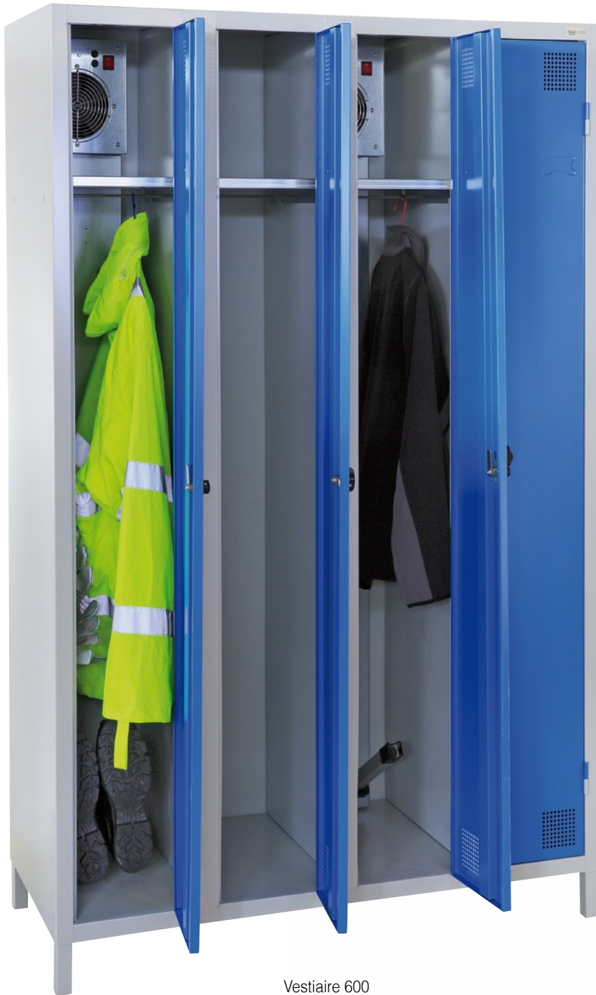
Vestiaire 600 2 cases