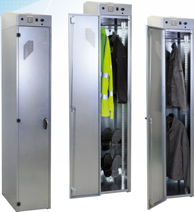
Séchoir Multi 400 galvanisé