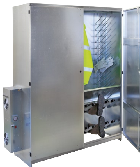
Séchoir avec portes