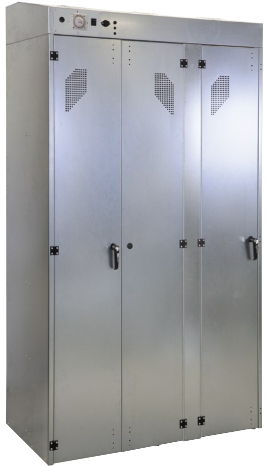
Séchoir Multi 1200 galvanisé 3 portes